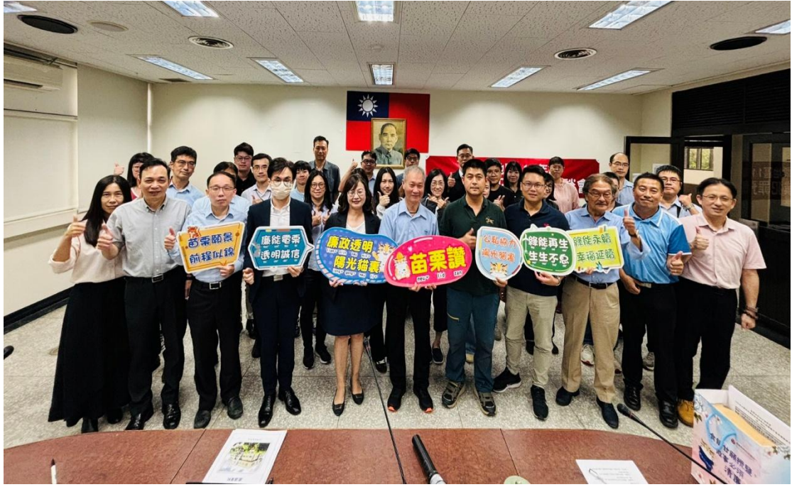
綠能企業座談會合影